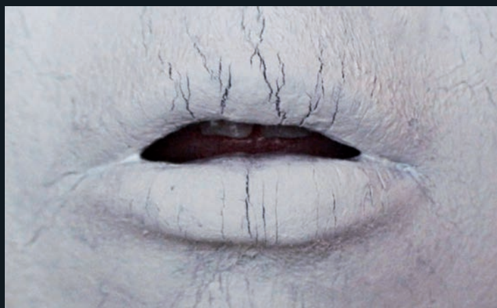
Anaïs LELIÈVRE , Je te l'ai déjà dit , 2010, vidéo, 12'59" © Anaïs Lelièvre