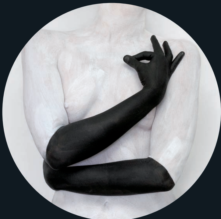
Laura TODORAN , Leda et le cygne , 2012, photographie numérique, 60 x 60 cm